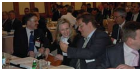
Делегаты обмениваются визитными карточками в начале мероприятия

08.00 Регистрация участников конференции и кофе.